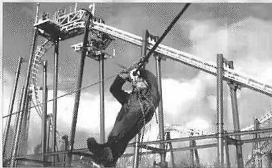
Links: het laatste stukje van de afdaling moet op splerkraft worden afgelegd.

"Ik wil het ook niet weten. Om operationele omstandigheden heb je ook niet wat je over een uur doet. Met een gecombineerde oefening als de schietserie en Raging Bull verbreed je je kennis en doe je je vertrouwen op. Dat vind ik het belangrijkste." ●