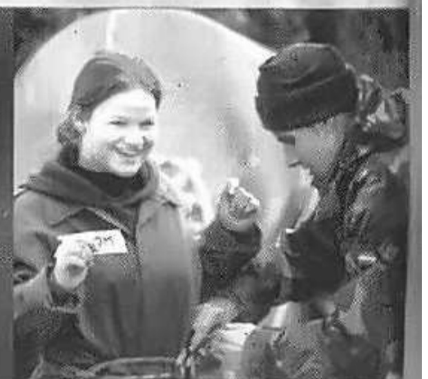
rechts: een leerling van het ROC is blij dat ze weer met beide benen op de grond staat.