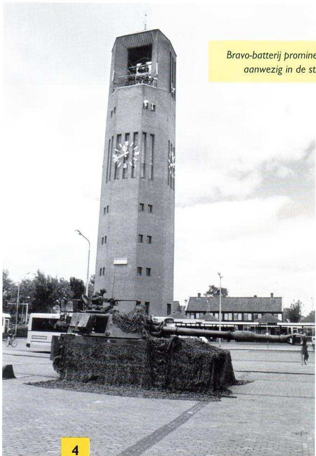
Bravo-batterij prominent aanwezig in de stad

De batterij deed woensdag 28 juni nadrukkelijk aan 'showing the flag'. Vlakbij de vier grote uitvalswegen van Emmeloord stonden observation posts (OP's) opgesteld. "Het is jammer dat wij de voertuigen niet op de hoofdwegen mogen neerzetten. Daarom